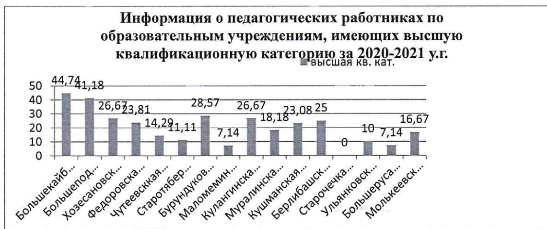
Рис. 2 Показатели высшей квалификационной категории в разрезе школ

Самые высокие показатели по наличию высшей квалификационной категории отмечаются в Большекайбицкой школе, Большеподберезинской, и Хозесановской школах. В образовательных учреждениях с наименьшими показателями по высшей категории необходимо усилить выполнение методической задачи по обеспечению роста квалификации педагогических работников (рис.3,4).